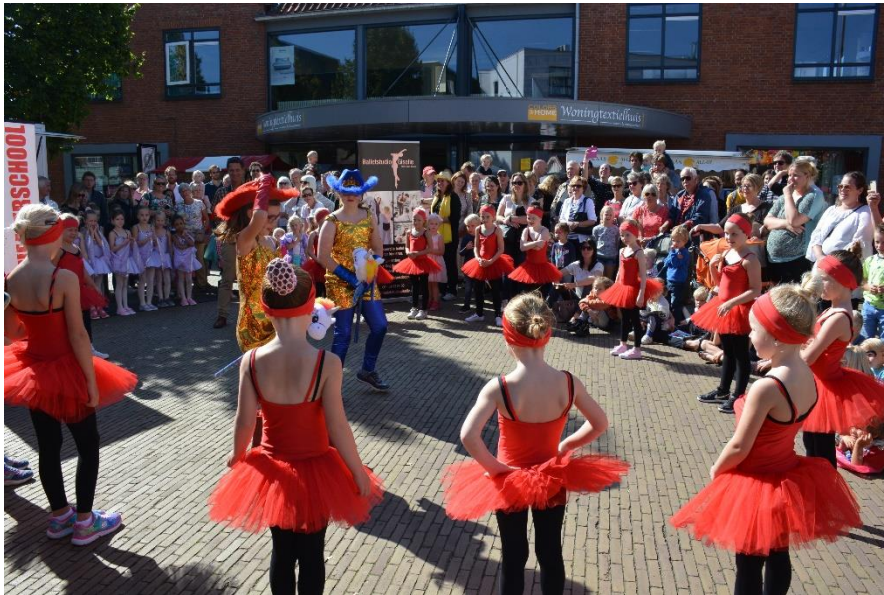
1. Jonge mensen dansen en spelen theater voor uiteenlopend publiek tijdens het Weekend van Voorschoten

Alle vormen van het actief beoefenen, artistiek ontwikkelen en betrokken zijn bij cultuur in de vrije tijd, dus buiten school en werk. Zelf maken, doen en leren. Een voorbeeld van een niet actieve vorm is het bezoeken en beschouwen van cultuur.